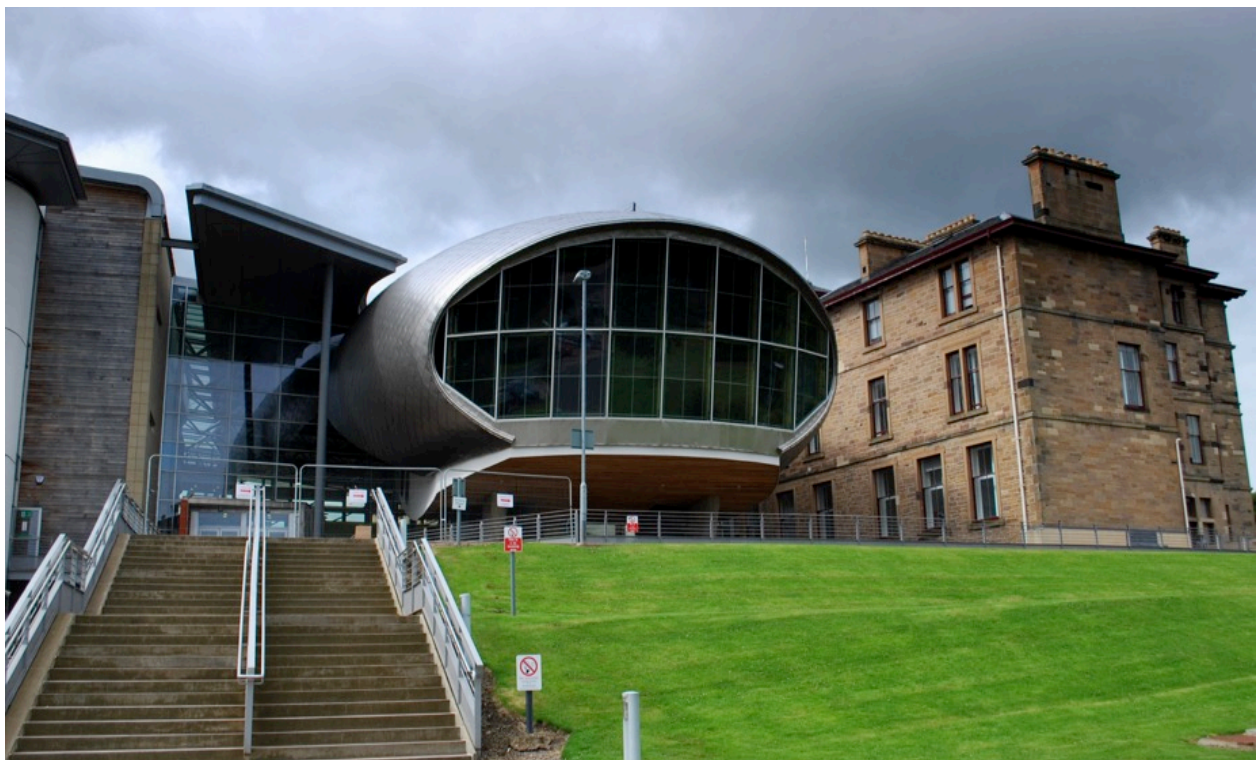
Edinburgh Napier University