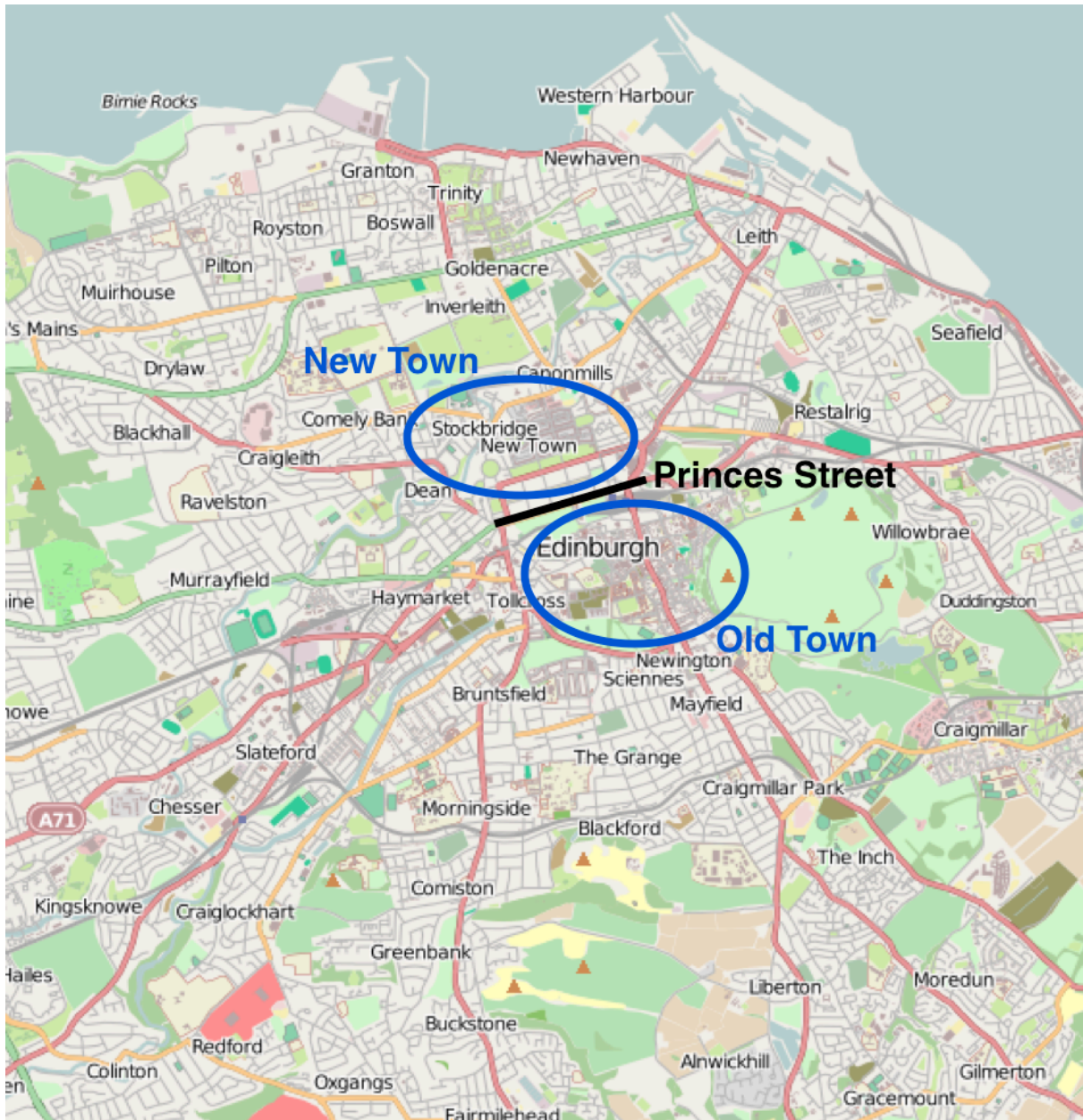
Abbildung 4: Edinburgh nach Bezirken

Edinburgh ist ein sehr wichtiger Verkehrsknotenpunkt und hat somit Straßen- und Bahnverbindungen mit dem übrigen Schottland und England. Die Waverley Station ist ein Bahnhof im Stadtzentrum und bietet wichtige Verbindungen in Richtung Mittelengland und London. Seit 2012 gibt es eine Straßenbahn, die unter anderem den Flughafen und das Stadtzentrum verbindet. Des Weiteren hat Edinburgh eine umfassende Fernstraßenanbindung an das Straßennetz von Großbritannien. Daneben bestehen zwei Autobahnen, die M8 nach Glasgow und die M9 nach Stirling.