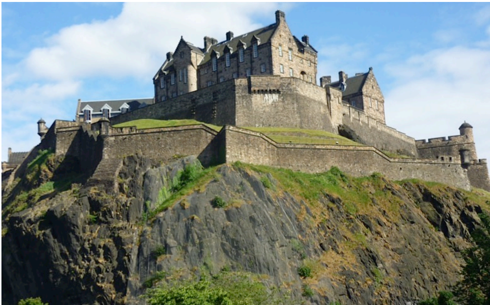
Abbildung 13: Edinburgh Castle

Arthurs Seat: Dieser 251 Meter hohe Berg befindet sich ebenfalls fast direkt in der Stadt und wird somit vollständig vom Siedlungsgebiet umgeben. Von der Spitze hat man einen wunderschönen Rundumblick.