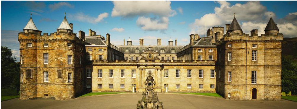
Abbildung 16: Holyrood Palace

Scotch Whiskey Experience: 354 Castlehill, Edinburgh EH1 2NE. Auf keinen Fall sollten Sie sich eine Whiskey Tour entgehen lassen mit anschließender Whiskey Probe. Eine 1,5 Stunden Tour mit anschließender Whiskey Verkostung kostet 24,50 Pfund pro Person.