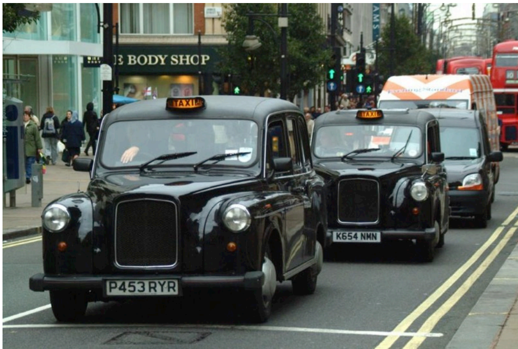
Abbildung 6: Typische Taxis in Edinburgh

Taxis gibt es ebenfalls im Überfluss in Edinburgh. Diese empfehlen sich jedoch im Normalfall nicht, da diese überdurchschnittlich teuer sind im Vergleich zu Deutschland. Zudem werden viele Busverbindungen auch nachts bedient, sodass ein Taxi überflüssig wird. Wer sich dennoch für ein Taxi entscheidet sollte wissen, dass hier ein Trinkgeld von 10% die Norm ist.