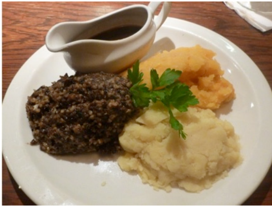
Abbildung 8: Haggis, Steckerrüben und Kartoffelbrei

schottische Spezialität, die man unbedingt probieren sollte ist Haggis. Haggis besteht aus Herz, Leber, Lunge und Nierenfett vom Schaf das durch Zwiebeln, Hafermehl und Pfeffer ergänzt wird. Des Weiteren ist Fish'n'Chips in Schottland sehr beliebt und weit verbreitet. Für Deutsche ist die Kombination aus Fisch und Pommes meist gewöhnungsbedürftig, auf jeden Fall aber ein ‚Must Have‘.