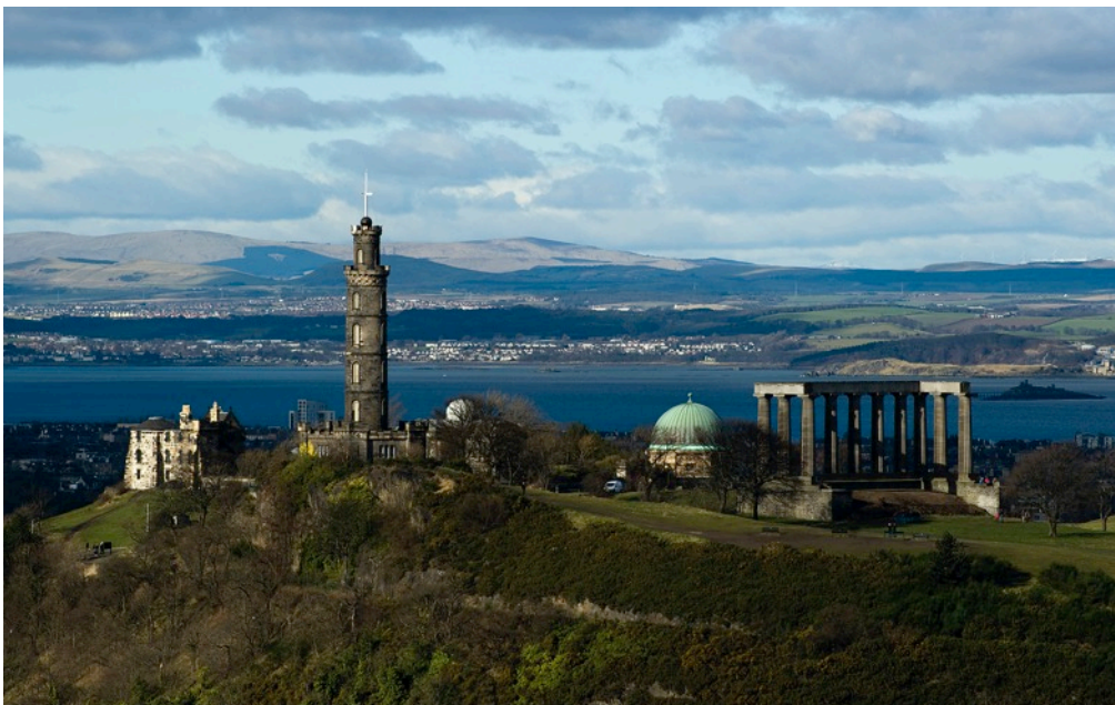
Abbildung 15: Calton Hill

Calton Hill: Dieser kleine Hügel befindet sich ebenfalls direkt am Stadtzentrum und besitzt zahlreiche Monumente. Sie sollten unbedingt auf den Aussichtspunkt des Turmes steigen. Von dort haben Sie einen Ausblick über die gesamte Stadt.