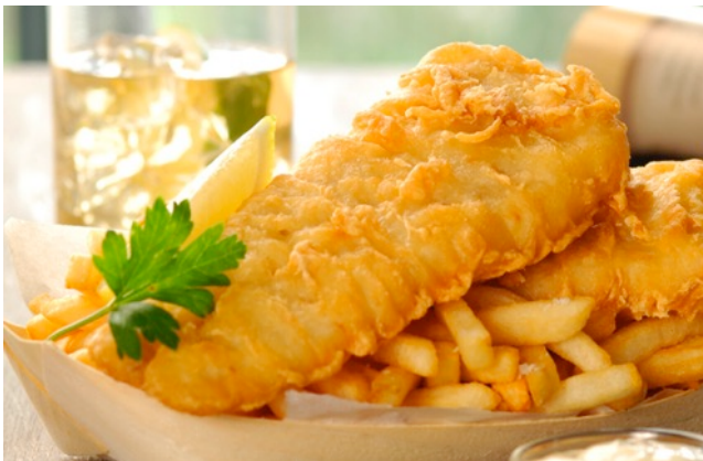
Abbildung 9: Fish'n'Chips