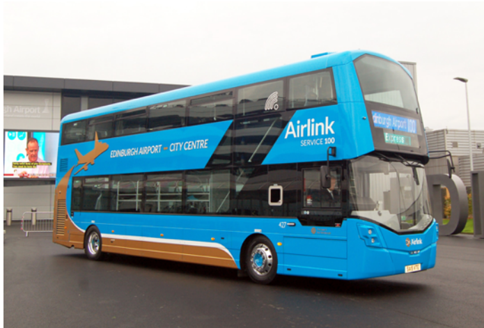
Abbildung 5: Airlink 100 Bus

Die beste Option um vom Flughafen in die Stadt zu kommen ist der Airlink Bus Nummer 100. Dieser fährt alle 10 Minuten 24/7 direkt vom Flughafen in die Innenstadt und bis zum Ocean Terminal. Eine Einzelfahrt kostet 4,50 Pfund, ein Return Ticket (offene Rückfahrt) kostet 7,50 Pfund. Die Fahrt ins Stadtzentrum (Waverley Bridge) dauert rund 40 Minuten.