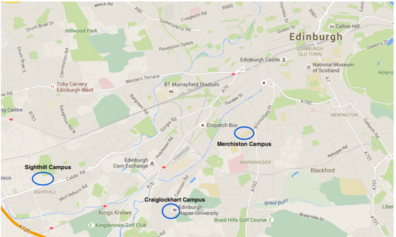
Abbildung 10: Lageplan Napier Universität