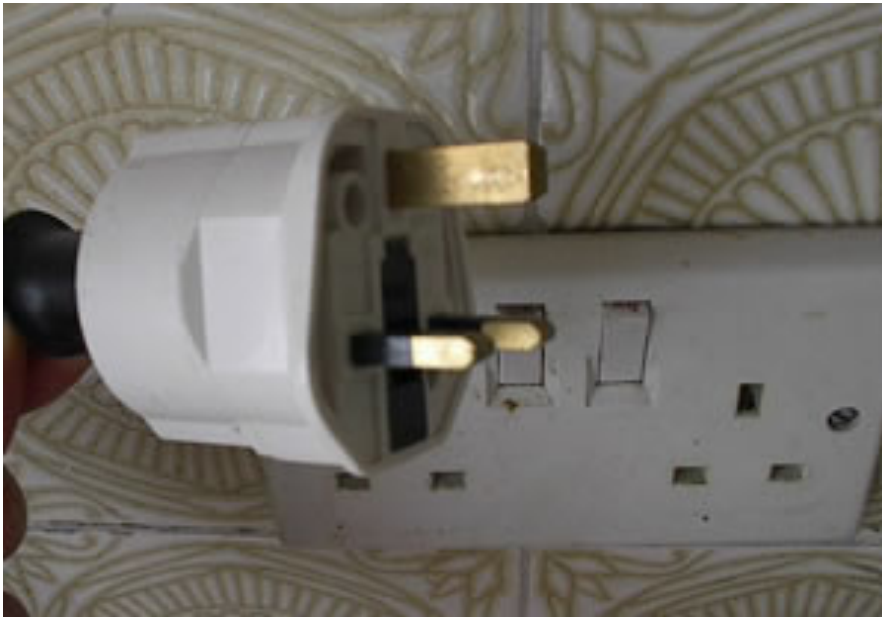
Abbildung 3: Dreipolige Steckdose

Das schottische Stromnetz ist mit 240 V Wechselstrom ausgestattet. Für die britischen dreipoligen und eckigen Steckdosen benötigt man einen Adapter (siehe folgendes Bild).