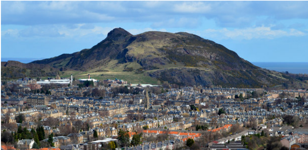
Abbildung 14: Arthurs Seat

Calton Hill: Dieser kleine Hügel befindet sich ebenfalls direkt am Stadtzentrum und besitzt zahlreiche Monumente. Sie sollten unbedingt auf den Aussichtspunkt des Turmes steigen. Von dort haben Sie einen Ausblick über die gesamte Stadt.