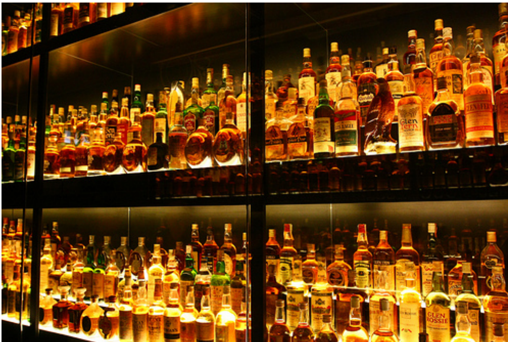
Abbildung 17: Scotch Whiskey Experience

Scotch Whiskey Experience: 354 Castlehill, Edinburgh EH1 2NE. Auf keinen Fall sollten Sie sich eine Whiskey Tour entgehen lassen mit anschließender Whiskey Probe. Eine 1,5 Stunden Tour mit anschließender Whiskey Verkostung kostet 24,50 Pfund pro Person.